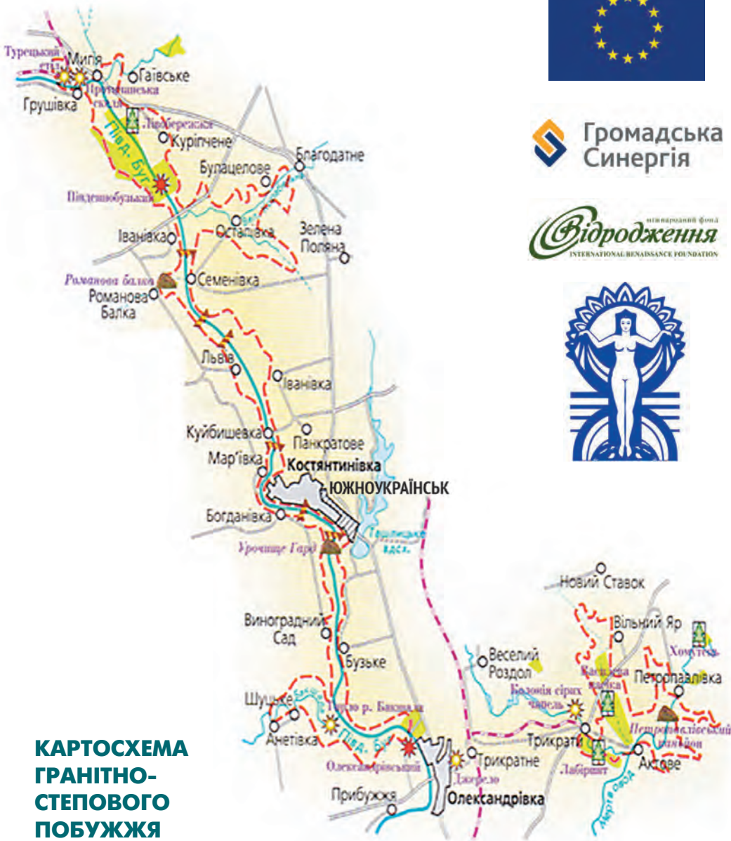
КАРТОСХЕМА ГРАНІТНО- СТЕПОВОГО ПУБУЖЖЯ