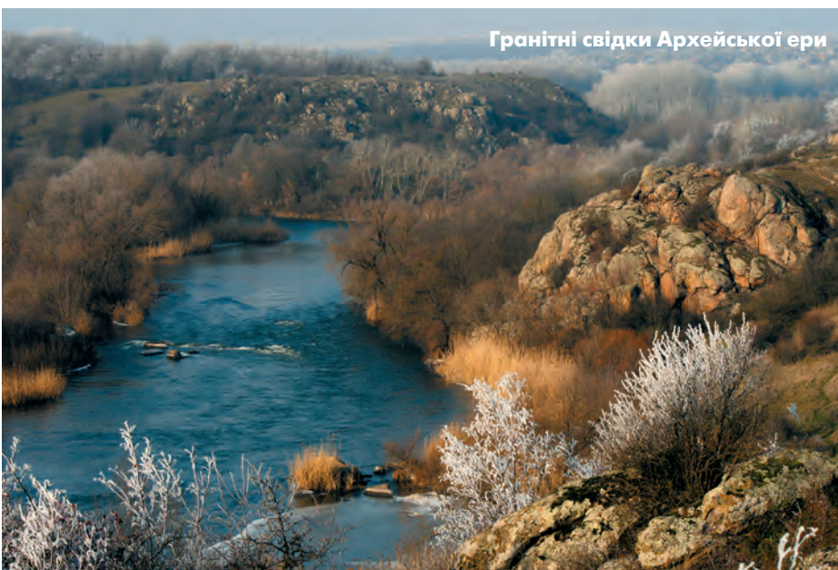
Гранітні свідки Архейської ери